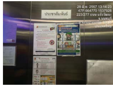
รูปที่ 35 บอร์ดประชาสัมพันธ์