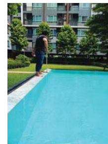
รูปที่ 38 เจ้าหน้าที่ดูแลทำความสะอาดสระว่ายน้ำ