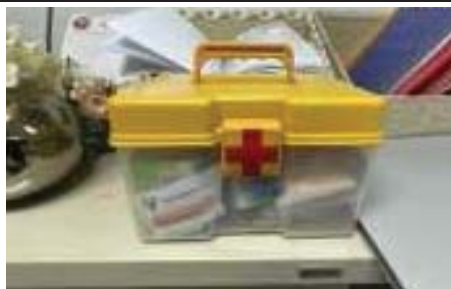
รูปที่ 39 ชุดปฐมพยาบาล