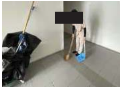
รูปที่ 36 พนักงานทำความสะอาดภายในอาคาร