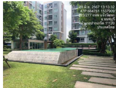
รูปที่ 37 สระว่ายน้ำ