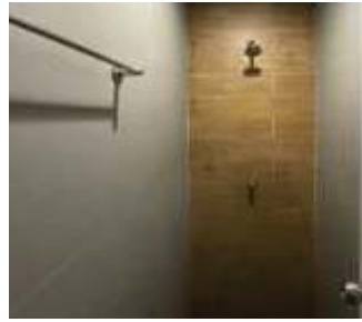
รูปที่ 41 อ่างล้างมือ และลานล้างตัวบริเวณสระว่ายน้ำ